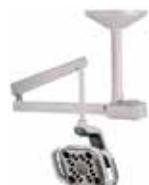
Montaggio a soffitto