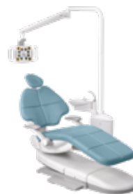
Montaggio a poltrona