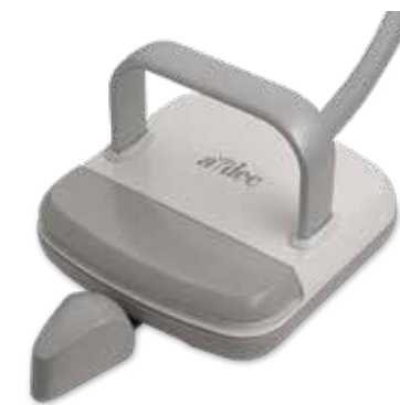
Pédale de commande à levier