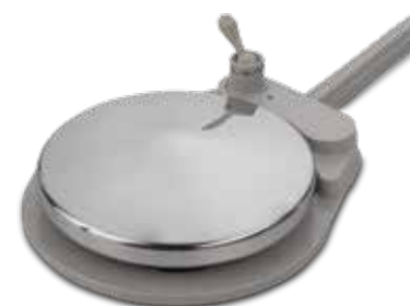
Pédale de commande à disque