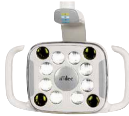
A-dec 500 LED