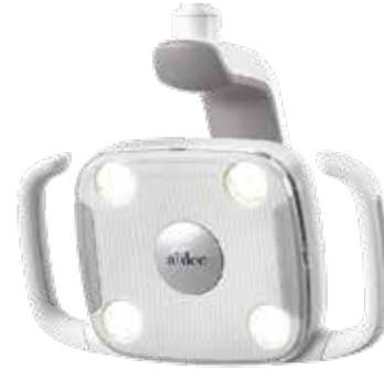
A-dec 300 LED

将牙医助理的临床设备放置在最方便使用的位置。可调节的3或4位置托架可用于治疗椅安装、痰盂安装或伸缩臂。