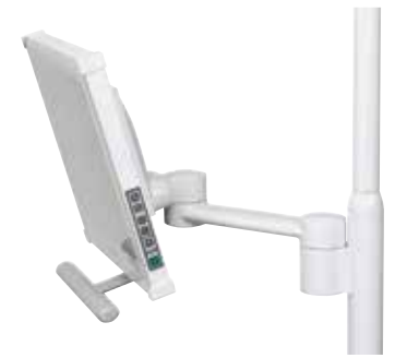
带连接臂的灯臂安装式显示器支架