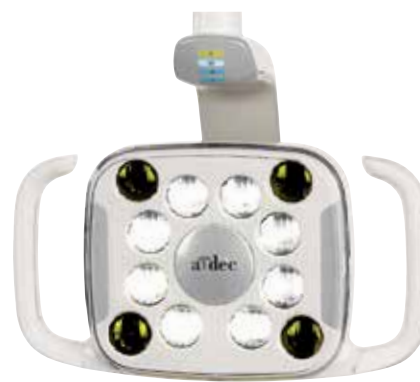
A-dec 500 lampa LED