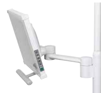
Mocowanie monitora Light z ramieniem