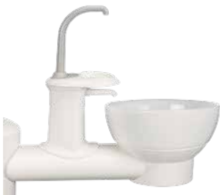
Nieruchoma szklana spluwaczka