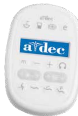
Panel sterowania Deluxe