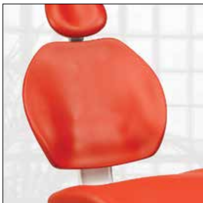
Tapicerka bezszwowa bez podłokietników