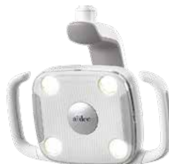
A-dec 300 lampa LED