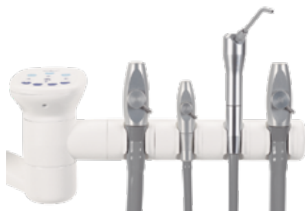
Držák se 4 polohami