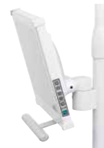
Konzola monitoru připevňená ke světlu