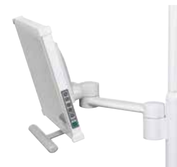
Konzola monitoru připevňená ke světlu s kloubovým ramenem