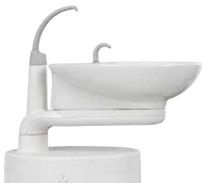
Otočné plivátko ze skelné keramiky