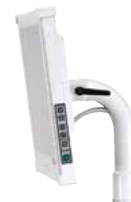
Konzola monitoru typu Radius