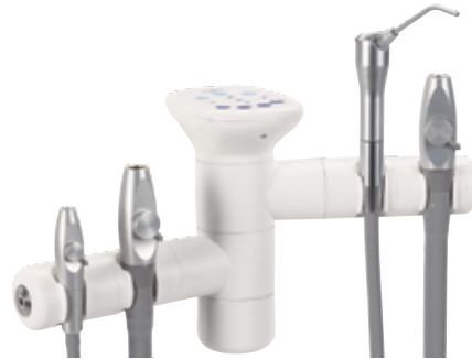
Dubbele houder met twee posities