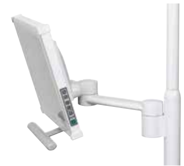
Monitormontage lamp met arm