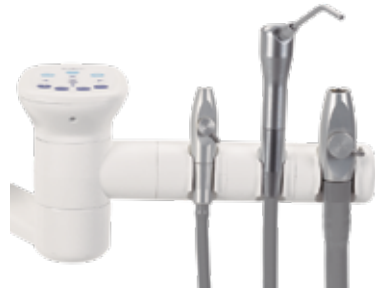
Houder met drie posities