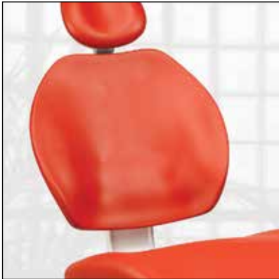
Naadloze bekleding, zonder armsteunen