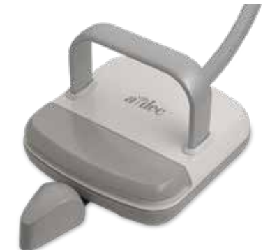
Voetpedaal met schuif