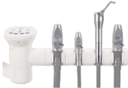
Houder met vier posities