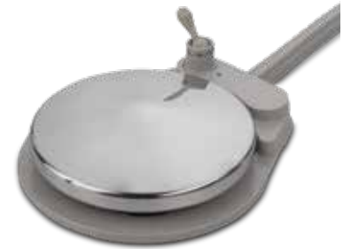
Voetpedaal met schijf